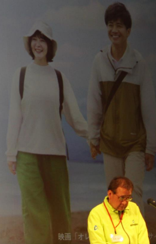
映画「オレから君へ」より