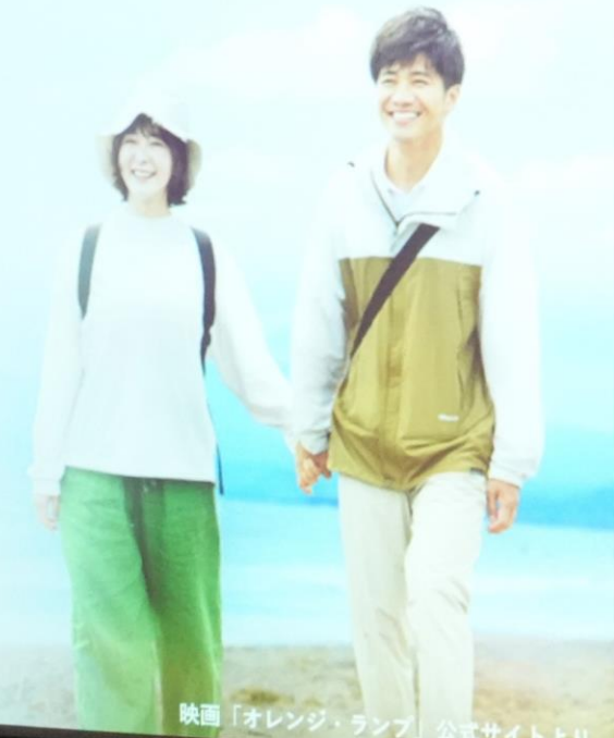
映画「オレンジ・ランプ」公式サイトより